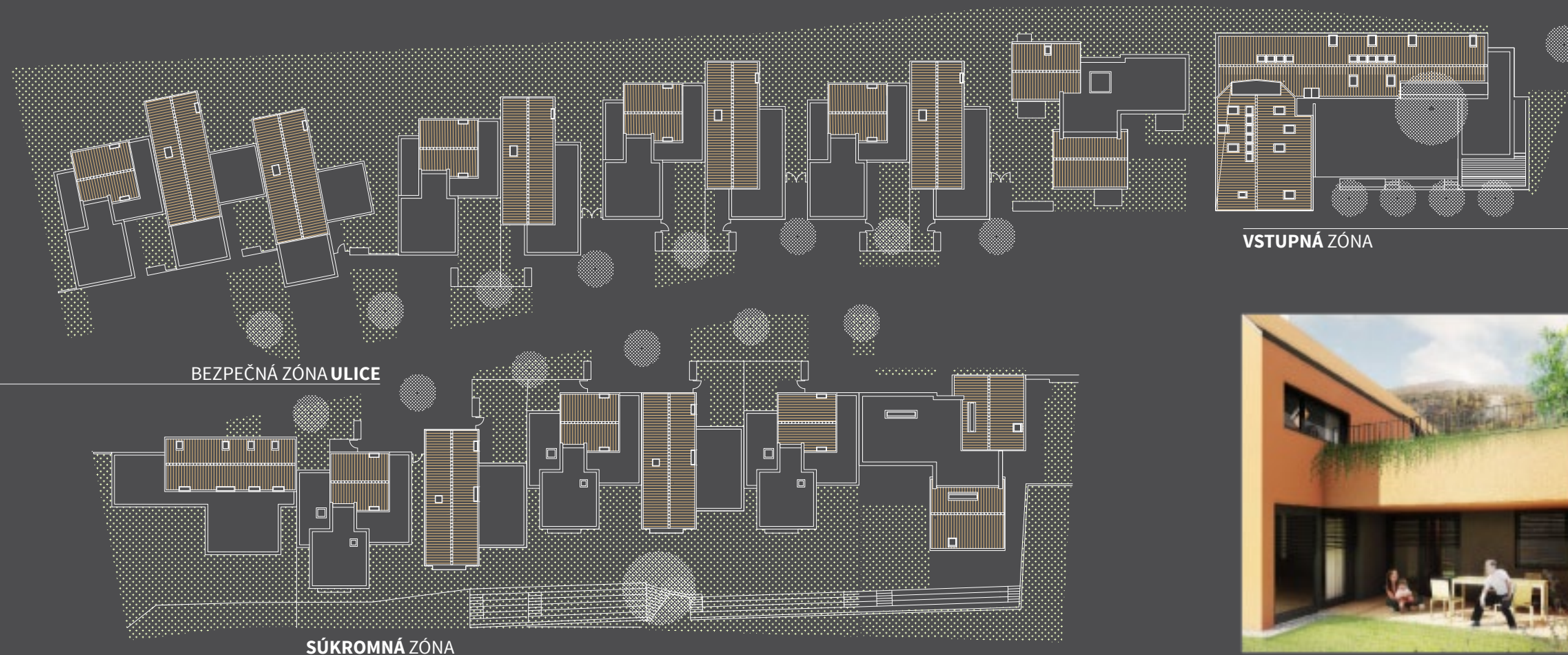
BEZPEČNÁ ZÓNA ULICE