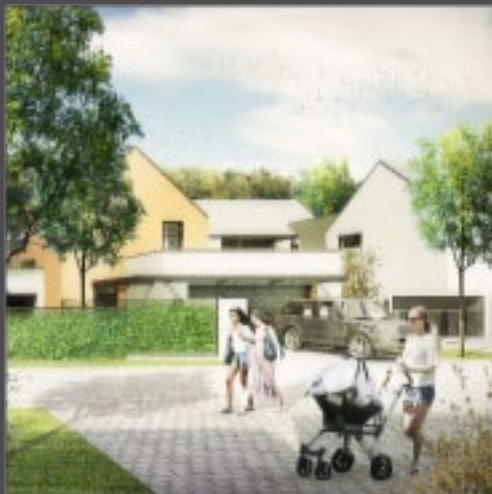
PRIEDOMIE AKO SÚČASŤ ŽIVOTNÉHO PRIESTORU