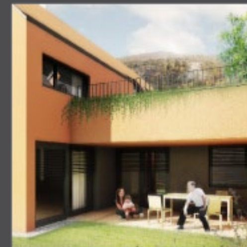
INTIMITA PRIVÁTNÝCH ZÁHRAD